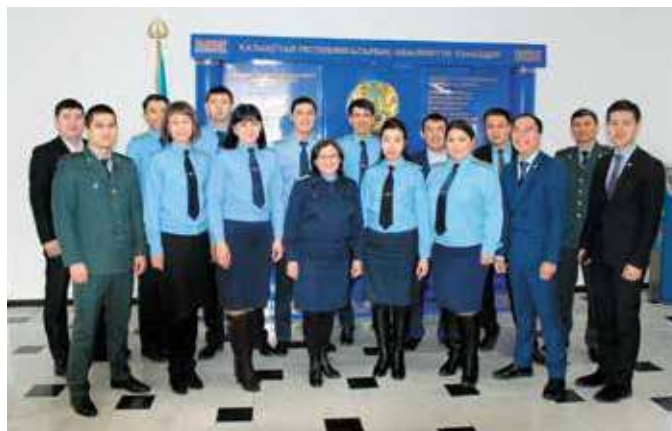
Фрагменты курсов для государственных обвинителей. Моделирование судебного заседания

За непродолжительный период подготовлено 5 методических рекомендаций. Особенность которых, прежде всего, заключается в их практической направленности, а также краткости и содержательности ( касаются только сути рассматриваемого вопроса ).