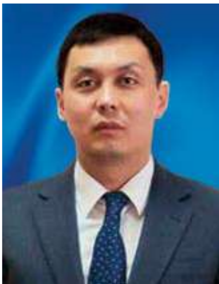
ZHUMAGALI Askhat Zhumagalievich, 1 National Bureau of Anti-Corruption of the Agency of the Republic of Kazakhstan for Civil Service Affairs and Anti- Corruption