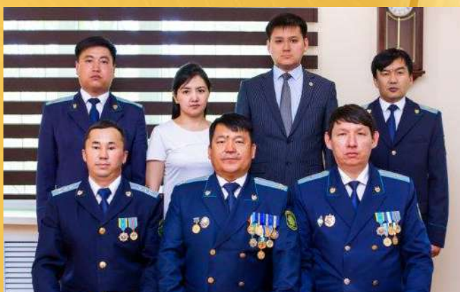
ПРОКУРАТУРА ТАЛАСКОГО РАЙОНА