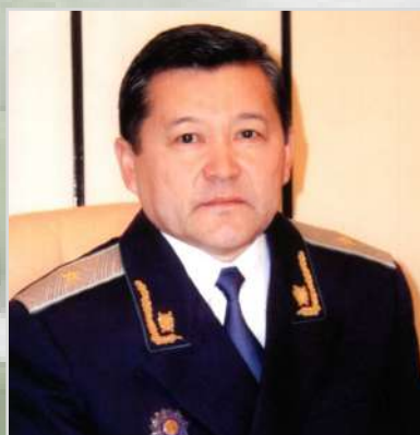
ПАКИРДИНОВ Мухамеджан Ахмедиевич Прокурор области с 2001 по 2003 год