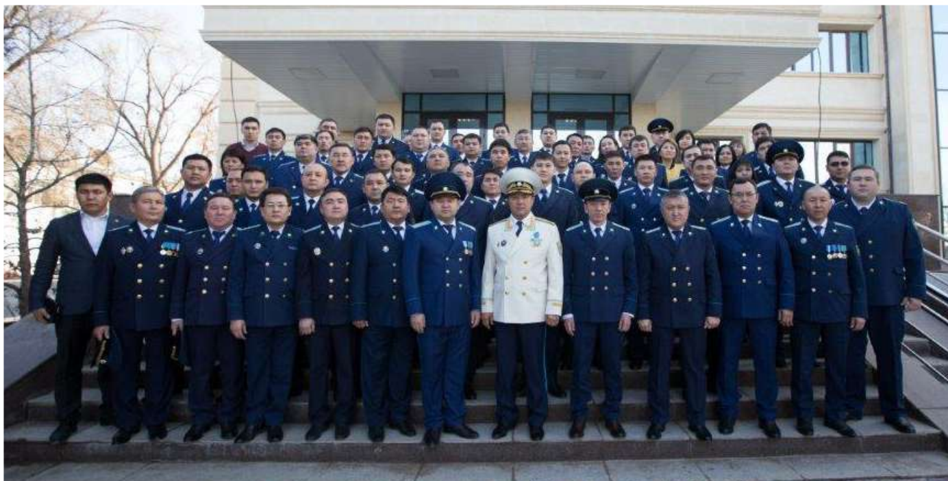
КОЛЛЕКТИВ ОБЛАСТНОЙ ПРОКУРАТУРЫ, 2018 г.