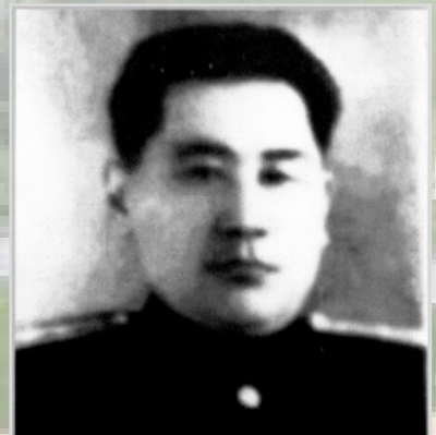
НУРГАЗИНОВ Туке Прокурор области с 1952 по 1962 год