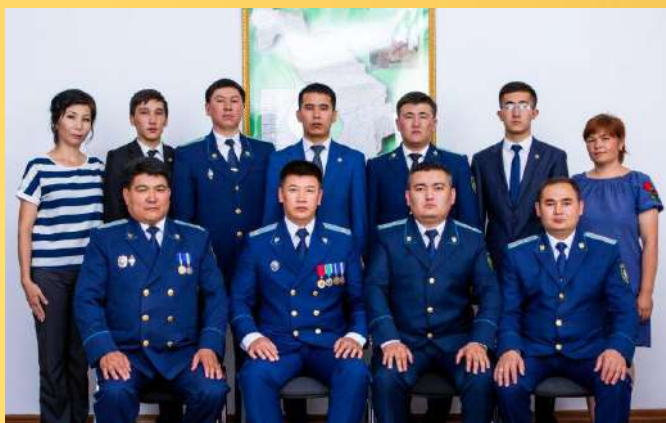
ПРОКУРАТУРА МЕРКЕНСКОГО РАЙОНА