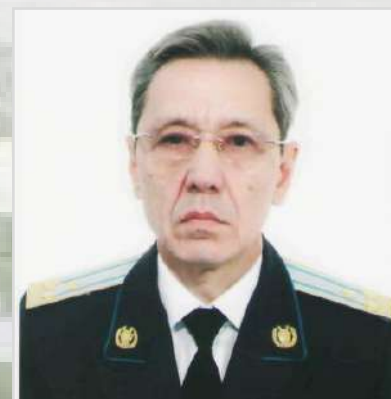
ДОСАНОВ Есенжан Кайыржанович Прокурор области с 2009 по 2010 год