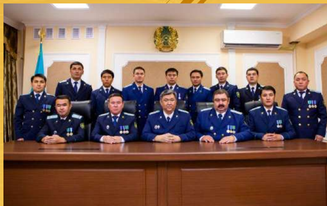
УПРАВЛЕНИЕ УГОЛОВНОГО ПРЕСЛЕДОВАНИЯ