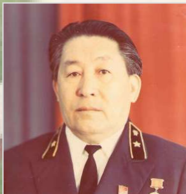
ИБРАЕВ Тилепалды Пирменович Прокурор области с 1977 по 1984 год