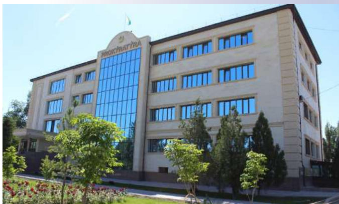
Здание прокуратуры 2019 г.

Мы гордимся тем, что в свое время должность прокурора Жуалынского района занимал Народный Герой и Великий полководец Бауыржан Момышулы. В органах прокуратуры Жамбылской области служили 15 фронтовиков.