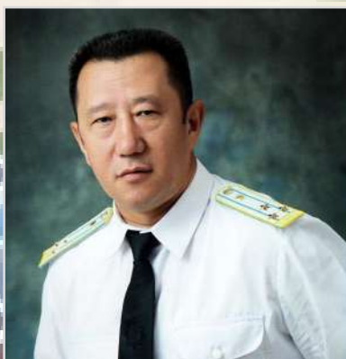
ТАЙМБЕТОВ Багбан Таимбетович Прокурор области с 2010 по 2012 год