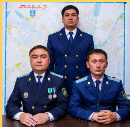
УПРАВЛЕНИЕ СПЕЦИАЛЬНЫХ ПРОКУРОРОВ