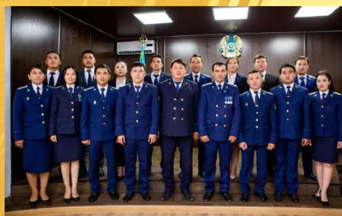
ОТДЕЛ ПО ЗАЩИТЕ ОБЩЕСТВЕННЫХ ИНТЕРЕСОВ ПРОКУРАТУРЫ Г. ТАРАЗ