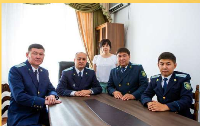
ПРОКУРАТУРА САРЫСУСКОГО РАЙОНА