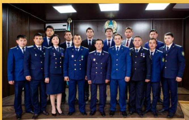
ОТДЕЛ УГОЛОВНОГО ПРЕСЛЕДОВАНИЯ ПРОКУРАТУРЫ г. ТАРАЗ