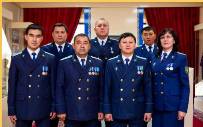
УПРАВЛЕНИЕ ПО ПОДДЕРЖАНИЮ ГОСУДАРСТВЕННОГО ОБВИНЕНИЯ И УЧАСТИЮ В АПЕЛЛЯЦИОННОЙ ИНСТАНЦИИ