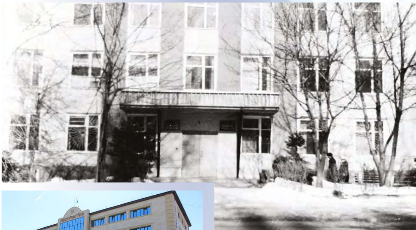
Здание прокуратуры 1939 г.