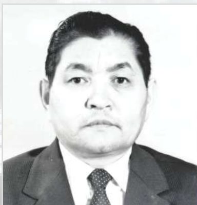
БАЙМУХАНОВ Пазылкарім Алтынханович Прокурор области с 1989 по 1992 год