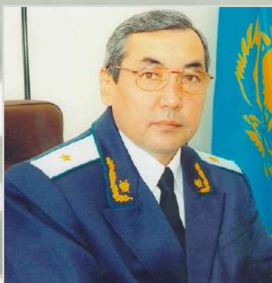
ТОЛЕГЕНОВ Кабдолла Досбалаевич Прокурор области с 1998 по 2001 и с 2003 по 2008 годы