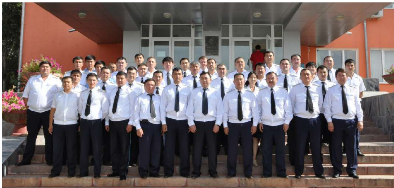
КОЛЛЕКТИВ ОБЛАСТНОЙ ПРОКУРАТУРЫ, 2010 г.