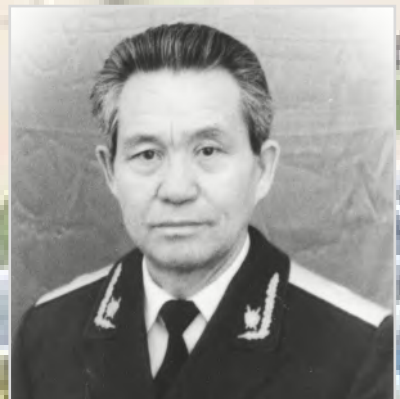
АБДРАХМАНОВ Акаш Абдрахманович Прокурор области с 1984 по 1989 год