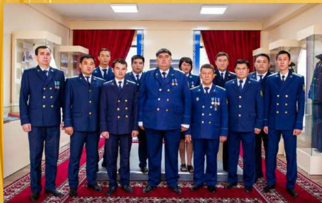
УПРАВЛЕНИЕ ПО ЗАЩИТЕ ОБЩЕСТВЕННЫХ ИНТЕРЕСОВ