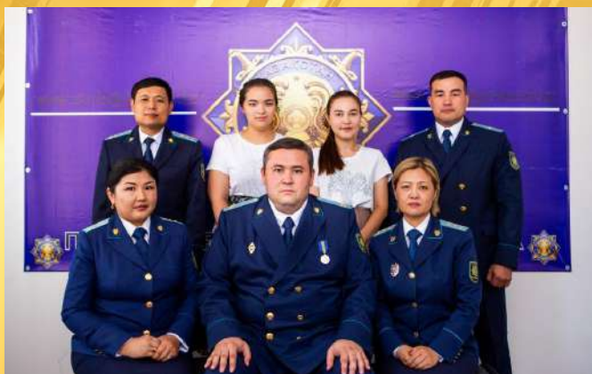
ПРОКУРАТУРА БАЙЗАКСКОГО РАЙОНА