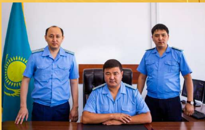
ПРОКУРАТУРА МОЙЫНКУМСКОГО РАЙОНА