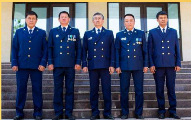
УПРАВЛЕНИЕ ПО НАДЗОРУ ЗА ЗАКОННОСТЬЮ ОПЕРАТИВНО-РОЗЫСКНОЙ ДЕЯТЕЛЬНОСТИ И НЕГЛАСНЫХ СЛЕДСТВЕННЫХ ДЕЙСТВИЙ