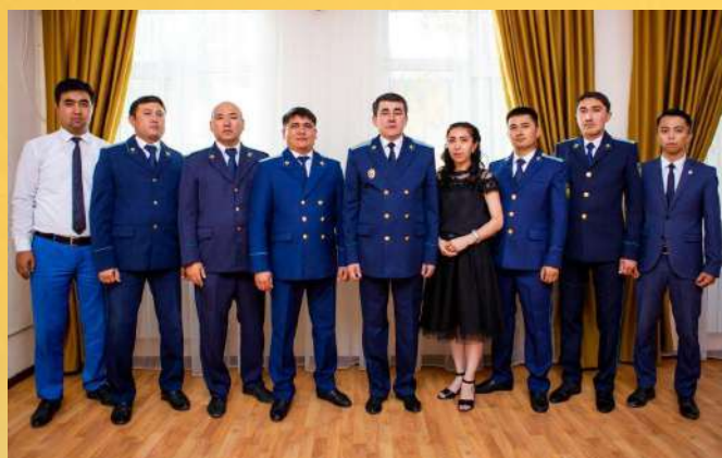
ПРОКУРАТУРА КОРДАЙСКОГО РАЙОНА