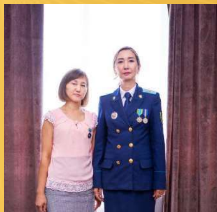
ГРУППА ПО НАДЗОРУ ЗА ПРИМЕНЕНИЕМ ЗАКОНОВ И ГОСУДАРСТВЕННЫХ СЕКРЕТОВ