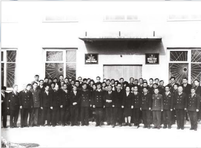
КОЛЛЕКТИВ ОБЛАСТНОЙ ПРОКУРАТУРЫ, 1966 г.