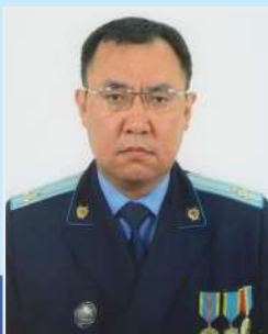
Телеу Баглан Балтабайұлы старший советник юстиции