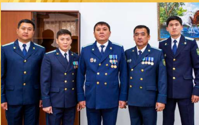
УПРАВЛЕНИЕ ПО НАДЗОРУ ЗА ИСПОЛНЕНИЕМ ПРИГОВОРОВ