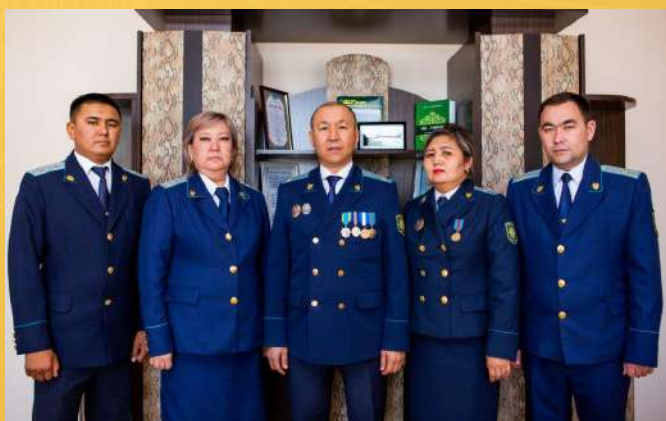
ШУСКАЯ МЕЖРАЙОННАЯ ПРОКУРАТУРА