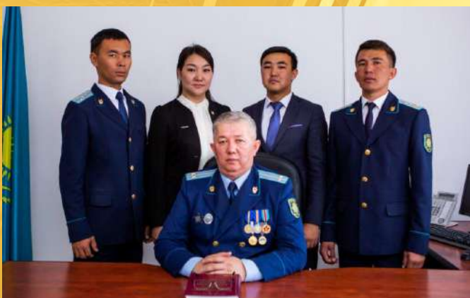
ПРОКУРАТУРА Т. РЫСКУЛОВСКОГО РАЙОНА