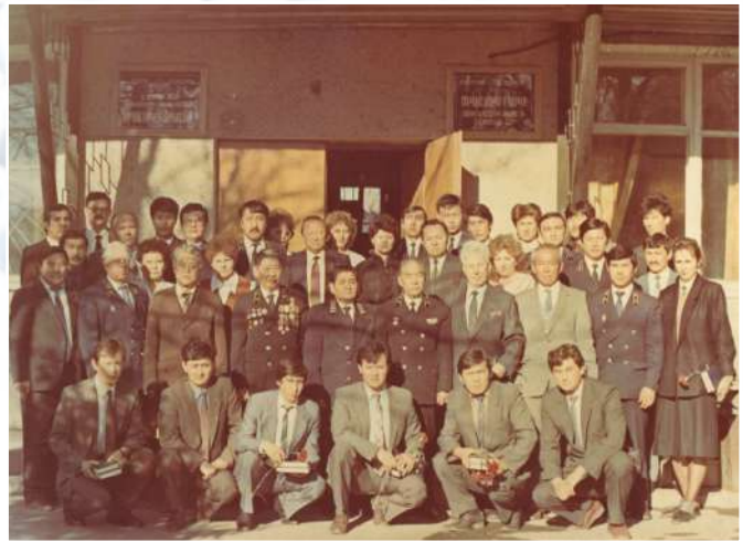
КОЛЛЕКТИВ ОБЛАСТНОЙ ПРОКУРАТУРЫ, 1975 г.