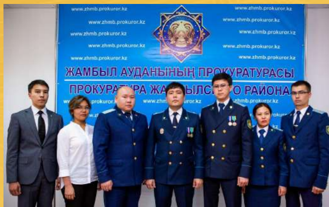
ПРОКУРАТУРА ЖАМБЫЛСКОГО РАЙОНА