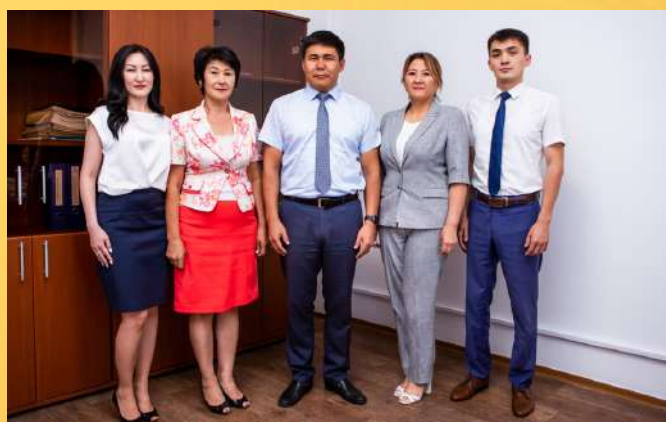
ОТДЕЛ ФИНАНСОВ И ИНФОРМАТИЗАЦИИ