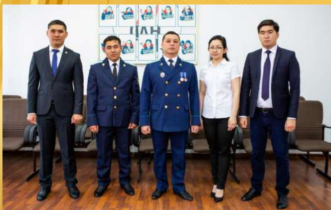
ПРОКУРАТУРА ЖУАЛЫНСКОГО РАЙОНА