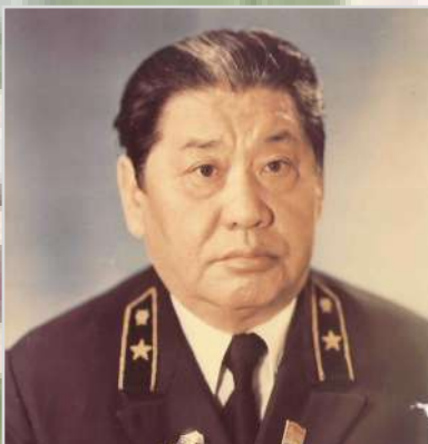
ТУРСЫНОВ Барян Турсынович Прокурор области с 1962 по 1977 год