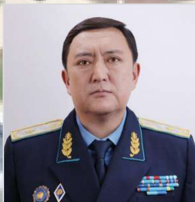
СЫБАНКУЛОВ Ернат Мухаметкалиевич Прокурор области с 2012 по 2017 год