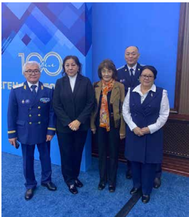
Ө. Сейітовтің 100 жылдығына арналған конференцияда

дай аға буындар еді, сол кездегі прокуратура басшылары! Өтеген Сейітұлы: Ұлы Отан соғысына қатысқан соғыс ардагері, келбетті, көркем сұлу азамат еді. Он сегіз жыл бойы Қазақ ССР-нің Бас прокуроры қызметін атқарып, қарапайымдылығы мен кісілігін асқақтатып, көптің құрметіне бөленген адам. 2013 жылы ол кісінің 90 жылдық мерейтойы Республика көлемінде атап өтілгені баршаңызға белгілі. Қазақстан прокуратурасының тарихында есімі алтын әріппен жазылған тұлғаның бірі Сейітов Өтеген Сейітұлы еді.