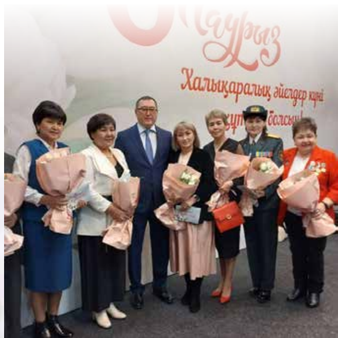
Облыс әкімінің салтанатты құттықтауы

Алматы облысы прокурорының бұйрықтарымен еңбек кітапшасына енгізу жолымен көптеген алғыстар жарияланды, сондай-ақ өз саласындағы елеулі еңбегі үшін 2020 және 2023 жылдары Алматы облыс прокурорынан «Құрмет грамотасымен» марапатталған.