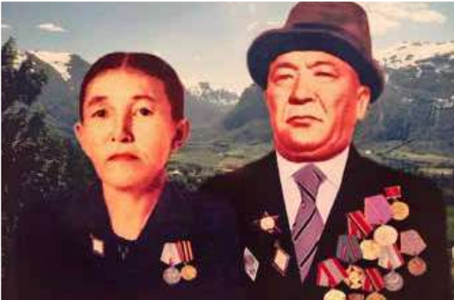
Атам мен әжем

ақыл қосты. Бағып-қағып өсірген әкемнің қарындасы заң саласының маманы болғанымды қалайтынын айтты.