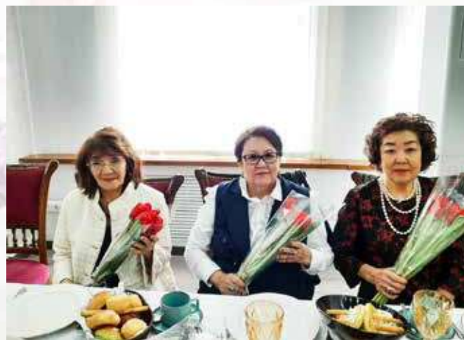
Ардагерлермен Халықаралық әйелдер күнінде кездесу сәті

Осындай қиын да, қызықты жылдарды артқа салып, аман-есен, абыроймен прокуратура органдарынан зейнеткерлікке шықтым. Қазіргі таңда Д. Қонаев атамыздың атындағы жоғары оқу орнында болашақ білікті де, білімді заңгерлерді дайындауда өз үлесімді қосып келемін.