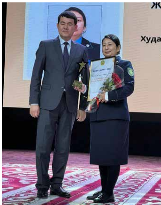
«Жыл адамы – 2023» номинациясын алған сәті