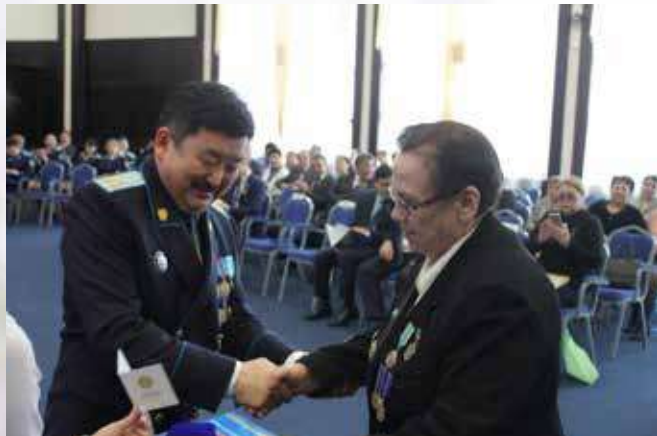
Награждение медалью, 2017 г.