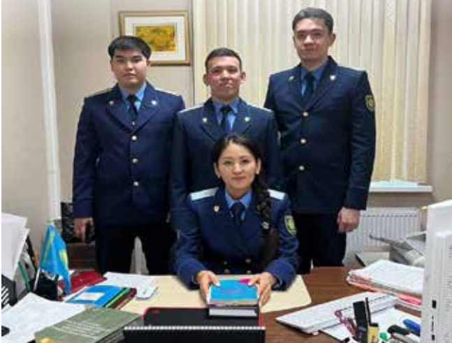
Фото с коллегами

Сегодня я тружусь в должности старшего помощника прокурора г. Астаны, немало пройдено и многое еще предстоит пройти.