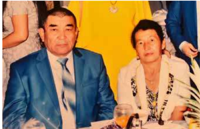
Әкем мен анам

Ал 2009 жылдың 29 желтоқсанынан бастап прокуратура саласында қызмет етіп келемін. Сарысу ауданы прокурорының көмекшісі, облыс прокуратурасының басқарма прокуроры