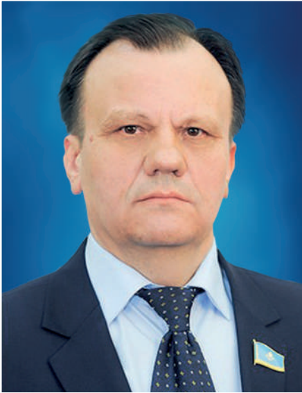
Василий Олейник, депутат Мажилиса Парламента Республики Казахстан