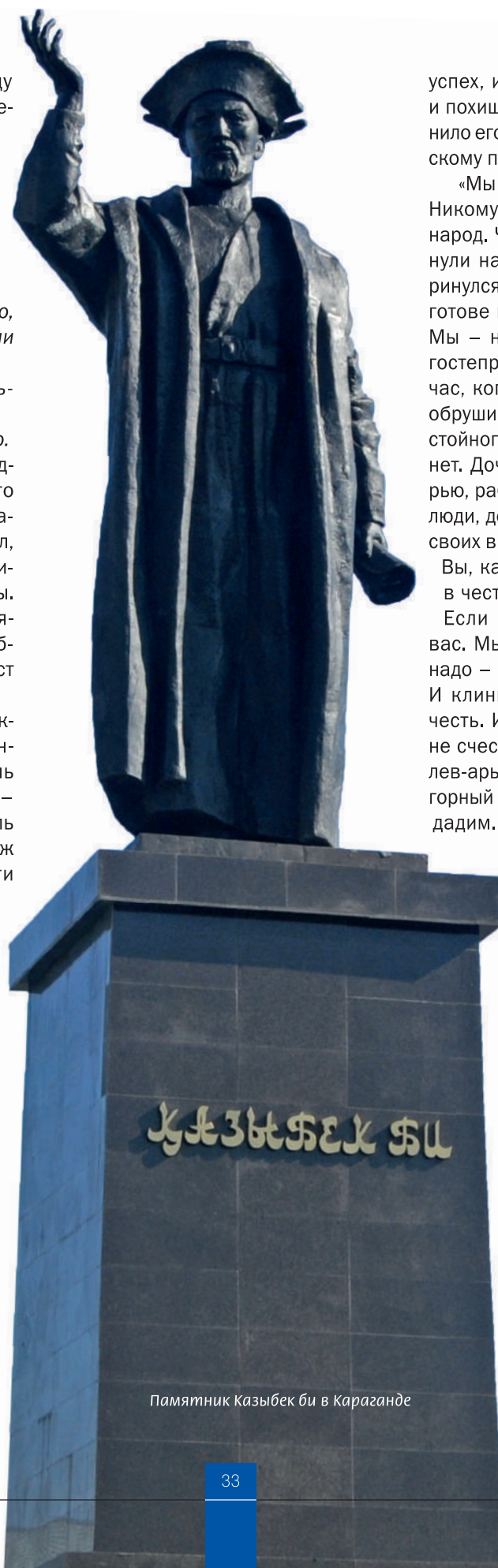
Памятник Казыбек би в Караганде

После этого визита было еще несколько поездок к джунгарам, в составе которого был и казахский дипломат-оратор Казыбек би, в ходе которых достигнуто соглашение «впредь жить в мире и согласии». В одной из таких поездок, проявив большую настойчивость, Казыбек би удалось вызволить из джунгарского плена батыра Абылая, султана среднего жуза, который позже стал ханом всех трех жузов. За освобождение султана Абылая правитель джунгар Галдан Церен выдвинул два условия: во-первых, самые извест-