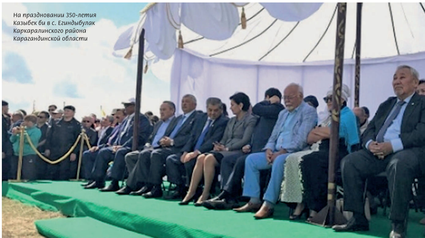
На праздновании 350-летия Казыбек би в с. Егиндыбулак Каркаралинского района Карагандинской области

По материалам пресс-службы Карагандинского областного суда, www.kazakh.ru , inkaraganda.kz , orken-media.kz , history.kz