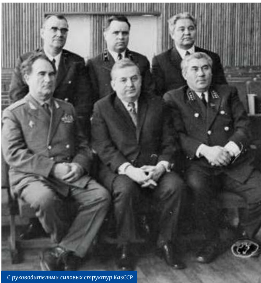
С руководителями силовых структур КазССР