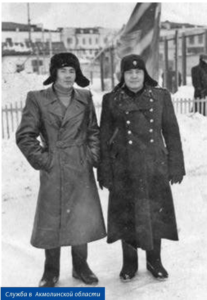
Служба в Акмолинской области

Прокурорские работники в целях предупреждения и пресечения вели принципиальную борьбу и достойно