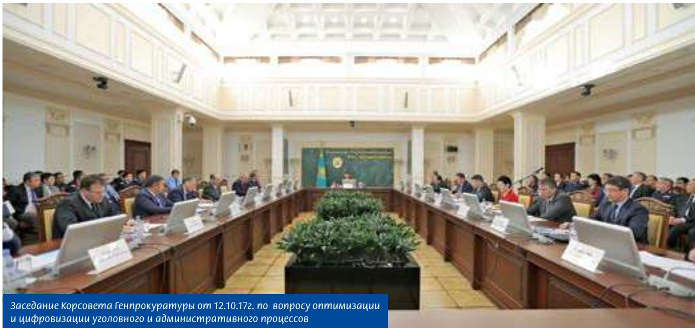
Заседание Корсовета Генпрокуратуры от 12.10.17г. по вопросу оптимизации и цифровизации уголовного и административного процессов

Уверен, что все эти меры позволят нам сделать уголовный процесс проще, быстрее и безопаснее для людей.