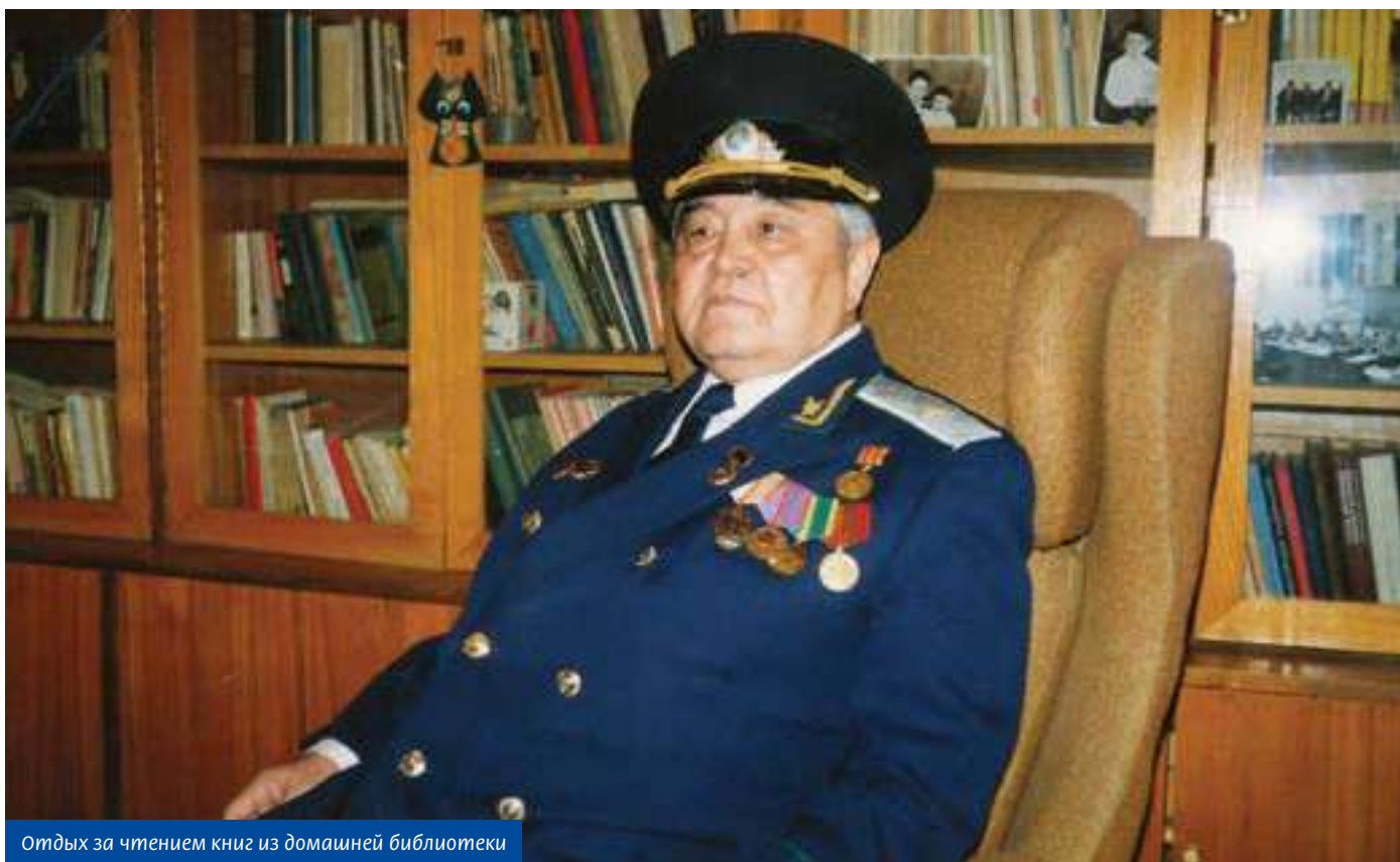
Отдых за чтением книг из домашней библиотеки