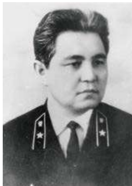
Молодой заместитель прокурора КазССР