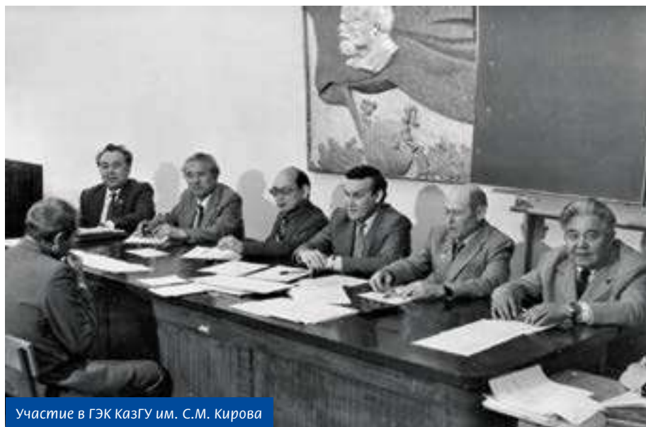
Участие в ГЭК КазГУ им. С.М. Кирова

академик Национальной академии наук Республики Казахстан, доктор юридических наук, профессор