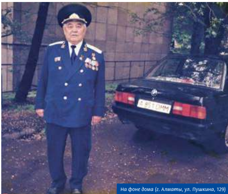
На фоне дома (г. Алматы, ул. Пушкина, 129)

Председатель Союза ветеранов органов прокуратуры Республики Казахстан, заслуженный юрист Казахской ССР