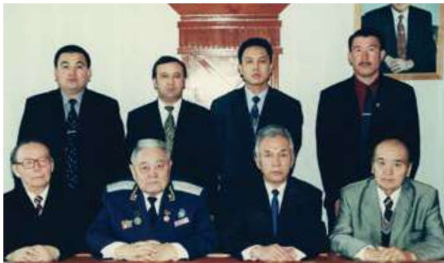
Коллектив кафедры уголовного процесса и судебной власти КазНУ им. аль-Фараби (2002 г.)

За период работы в КазГУ прошли два его юбилея (70 и 75 лет), которые превратились в праздничные мероприятия с участием известных юристов страны. Руководители разных административных ведомств, поздравляя юбиляра, выражали свою