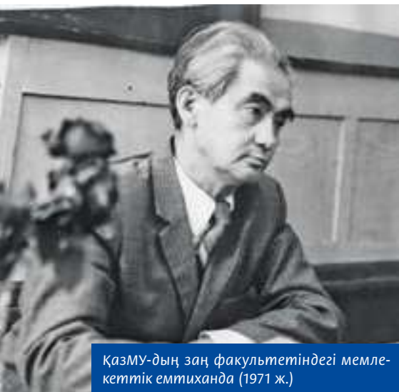
ҚазМУ-дың заң факультетіндегі мемлекеттік емтиханда (1971 ж.)