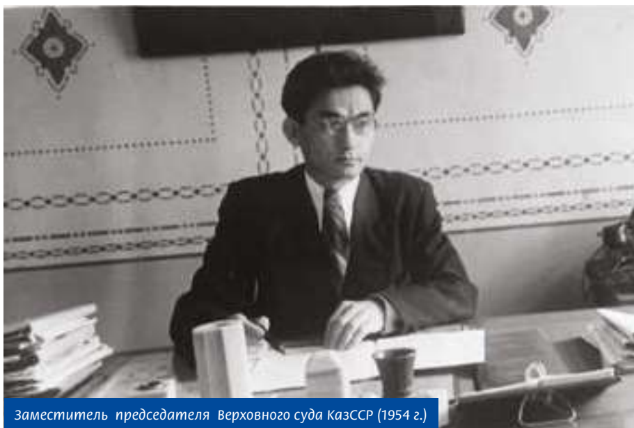
Заместитель председателя Верховного суда КазССР (1954 г.)

Скончался Асабай Мамутов в 1993 году. В г. Алматы и на его малой родине в Шардаре есть улицы, которые названы его именем. К 100-летию со дня рождения в Шардаре установлен бюст А.М. Мамутова.