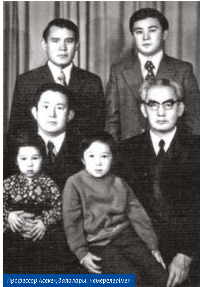
Профессор Асекең балалары, немерелерімен

Сырттай ағаның 30 жасында генерал, Республика прокуроры болғанын білетінбіз, біз танысқан кезде профессор, ғылым докторы еді. Бірақ дандайсу, өркөкіректік ол кісіге жат дүниелер болатын. Қарапайым, өте мәдениетті адам екенін бірінші күннен көрсетті. Аға сол сұрапыл соғыс кезіндегі кейбір қиын сәттерді, басынан өткен жайттардың шет жағасын айтатын. Қазақ жастары, оның ішіндегі ауыл жастары болшағын, қазақ тілінің мүшкіл күйін өте қиналып айтатын. Ол кезде Алматы қаласында қазақтар аз, жастарды қалада қалдармайтын, үй алу, тіркеуге тұру қазақ жастары үшін өте қиын еді. Қазақ жастары жақсы оқып, ғылым саласында, көбінесе құқық қорғау саласында көптеп тартылса, техника, құрылыс мамандықтарың меңгеріп, қалада көптеп қалар еді, болашақта қазақ тілі де жөнге келер еді деп айтатын. Сол кезде мүмкін балаларының қазақша білмейтіні, немерелері қазақ салт-санасын білмей кете ме деген қауіп болды ма екен. Бірақ тектіден текті туады деген бар емес пе, ағаның балалары қазақша да үйреніп алды, немерелерінің бір-екеуі қазақ мектебін