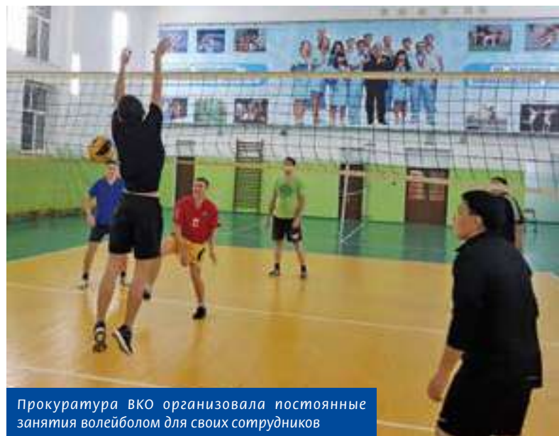
Прокуратура ВКО организовала постоянные занятия волейболом для своих сотрудников