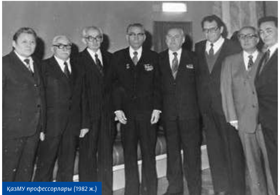
ҚазМУ профессорлары (1982 ж.)

Ағайдың тапсырмасын орындап, оқудан қолым босаған уақыттарда Асекең мен Зәкеңе барып сәлем беріп, амандық білісіп тұрдым. Асекең мені көрсе болғаны, қуанышын білдіріп, өзіне жақын отырғызып алады да: «Оқуың қалай, оқулықтарыңнан басқа кітаптар оқисын ба, бос уақытыңды қалай пайдаланасың, газет-журналдар оқисың ба, кинотеатрға барып тұрасың ба, институттың қоғамдық өміріне араласып қатысып тұрасың ба?» – деген сияқты сұрақ қойып, күнделекті өмірге қатысты, сондайақ болашақ байыпты еңбек-