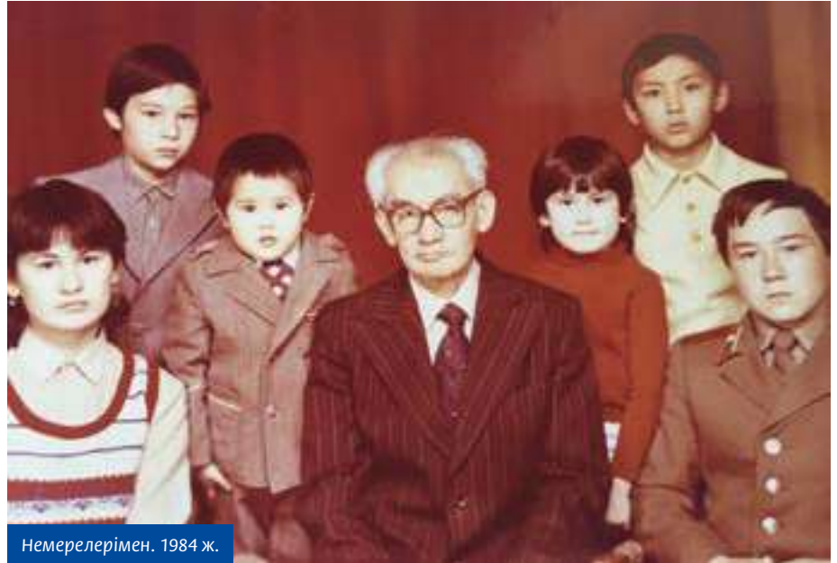
Немерелерімен. 1984 ж.

Мен осы хабарды естіген соң, ол кісіні 30-шы жылдардың соңы, 40-