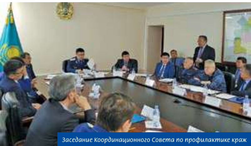
Заседание Координационного Совета по профилактике краж

экономических расследований пилотно внедрили программу «Электронное уголовное дело». Фактически это процедура сбора доказательств и составления процессуальных документов в электронном режиме. Уже в суд в таком формате направлено 3 таких дела, одно уже рассмотрено. Новшество должно охватить все стадии уголовного процесса: от регистрации преступления, его расследования и до исполнения приговора.