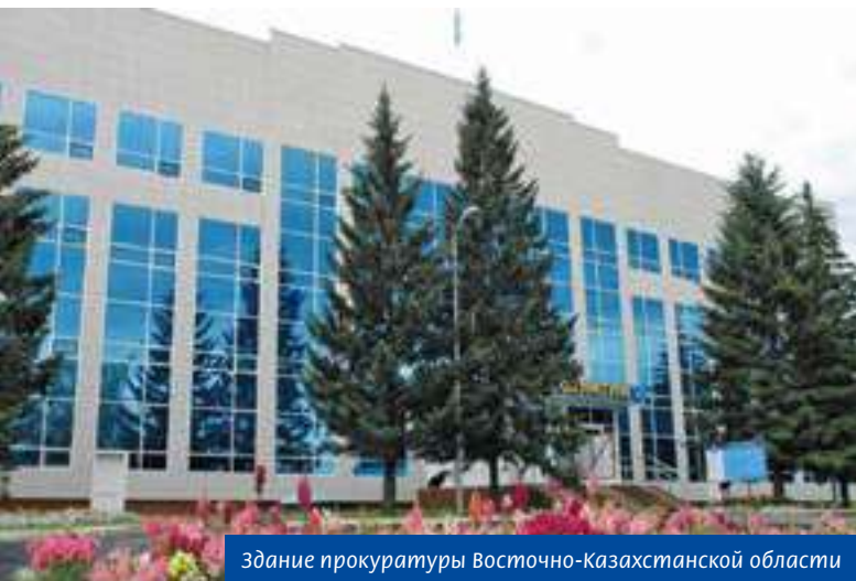
Здание прокуратуры Восточно-Казахстанской области

в ситуацию, когда человек уже потерял надежду на истину. Прокуратура – единственная возможность для многих людей добиться законности, отменить решение, вынесенное неправильно. Это и нравится больше всего в нашей работе – как бы высокопарно это не звучало – торжество закона и справедливости.