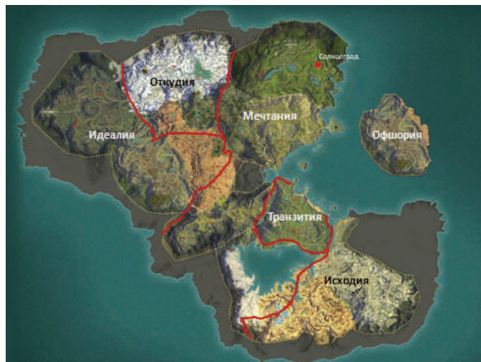
Карта вымышленных государств

Учитывая, что в тренинге участвуют представители разных государств с различным законодательством, разработчиками была создана вымышленная страна Мечтания со столицей в г. Солнцеграде, которую окружают страны с более или менее благополучной обстановкой, с низким уровнем доходов, а также зоны