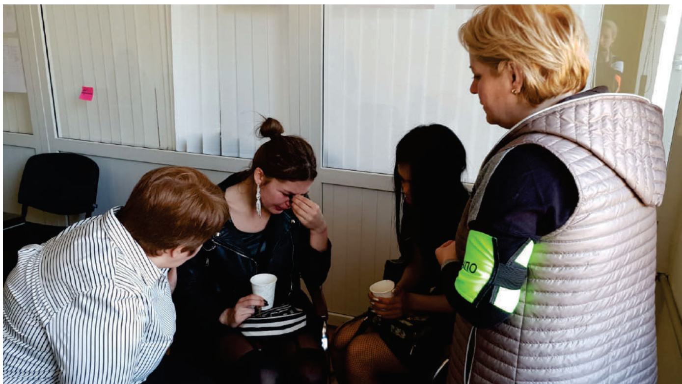
Работа психологов с жертвами торговли людьми

Одной из особенностей указанных тренингов явилось то, что злоумышленников и жертв преступления играли профессионально обученные актеры. При проведении первого тренинга все роли сыграли студенты Национального Университета искусств «Шабьт» и слушатели третьего курса Карагандинской Академии МВД им. Б. Бейсенова. Дебют состоялся и у сотрудников НПО «Қорғау», сыгравших роль главных организаторов преступления. Для сведения сценария воедино и проведения репетиций с актерами были приглашены профессиональные режиссеры. Актеры,