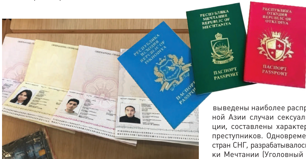
Документы граждан вымышленного содружества

конфликтов (Откудия, Идеалия, Офшория, Транзития, Исходия).