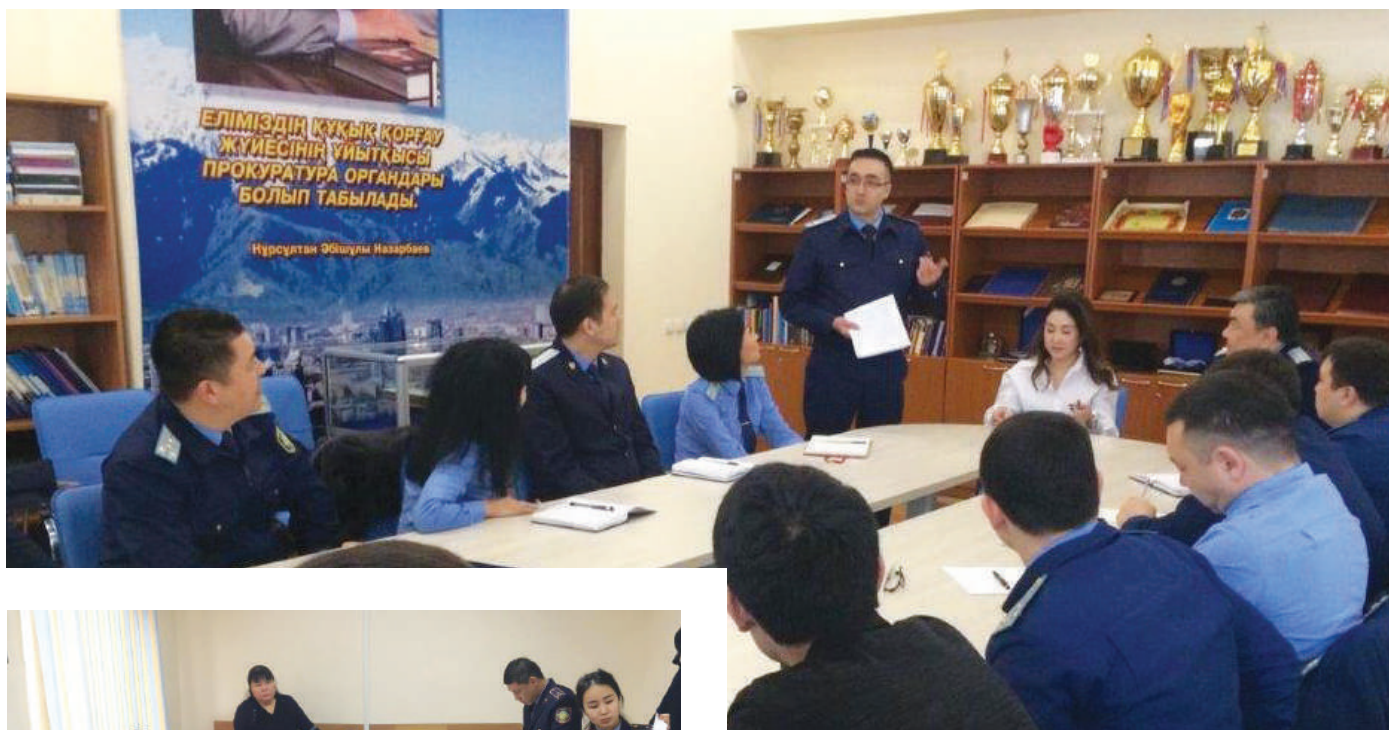
Проведение практических занятий

В частности, сокращение ошибок в повседневной работе отмечают 83% опрошенных руководителей, улучшение исполнения поручений и функциональных обязанностей – 92%, полноту исполнения поручений и заданий – 85%, проявление инициативы, активности при выполнении работы – 85%, использование новшеств и передовых технологий – 80%.