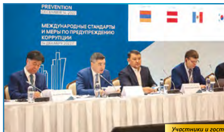
Участники и гости конференции

Біз осы жетістікпен тоқтап қалмай, халықаралық күн тәртібін күшейтуге ниеттіміз.